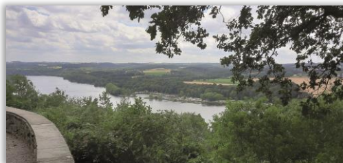
Blick von der Korte Klippe auf den Baldeneysee

Montag 10:00 Uhr - FW R/E - 4 Std. - 12 km - RW 09.06. Pfingstwanderung