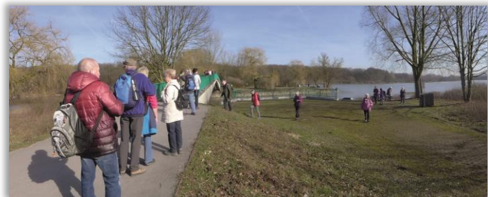
Brücke über den Hullerner Stausee

Sonntag 09:45 Uhr - FW R/E - 4 Std. - 12 km - RW 26.01. Rund um den Hullerner Stausee TP: Hbf. Vorhalle; VM: RE42, B272; VRR (B) Abf. 10:09 Uhr zur HSt. Haus Niemen Ank. 10:41 Uhr Wf. Ulrike Wegener , Tel.: 02361 / 6585288 Anmeldung bis 25.01. 20:00 Uhr