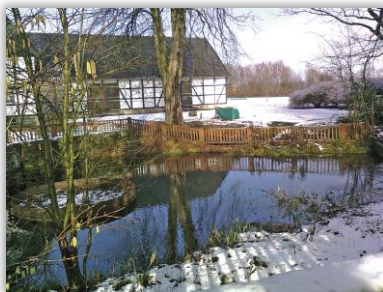
Quelltopf der Emscher

Sonntag, 26.10.2025 Umstellung auf Winterzeit