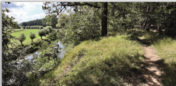
An der Stever