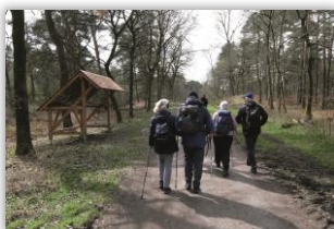
Auf der Ahsener Allee