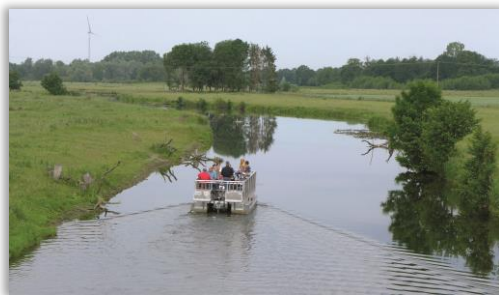
Floßfahrt in den Steverauen