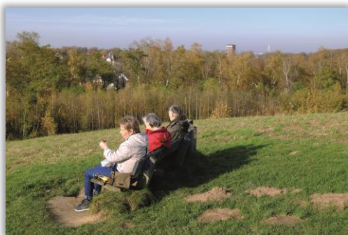
Auf der Halde Schwerin

Anmeldung bis 29.03. 20:00 Uhr bei Reinhard Klemp, Tel.: 02361 / 9434496