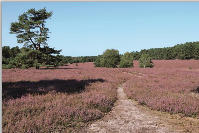
Heideblüte in der Misselhorner Heide