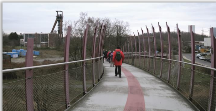
Blick von der Drachenbrücke auf die ehem. Zeche RE II