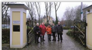
Am Schloß Westhusen