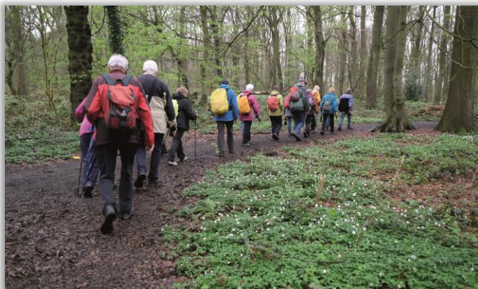
Buschwindröschen im Kölnischen Wald

Sonntag 08:50 Uhr - FW R/E - 4 Std. - 11 km - RW