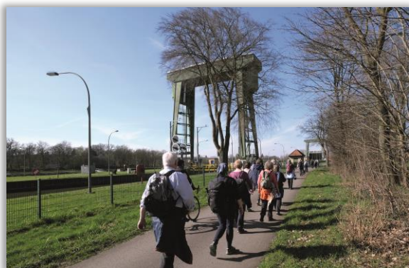
Wesel-Datteln-Kanal An der Flaesheimer Schleuse

Sonntag 09:50 Uhr - FW R/E - 4 Std. - 12 km - RW 02.02. Rund um Flaesheim TP: Hbf. Vorhalle; VM: RE2, B288; VRR (B) Abf. 10:04 Uhr zur HSt. Stiftsplatz Ank. 10:41 Uhr Wf. Kornelia Prescher , Tel.: 02361 / 32201 Anmeldung bis 01.02. 20:00 Uhr