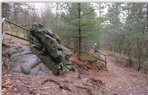
Überbleibsel vom Quarzit-Abbau Der Teufelsstein am Stimberg